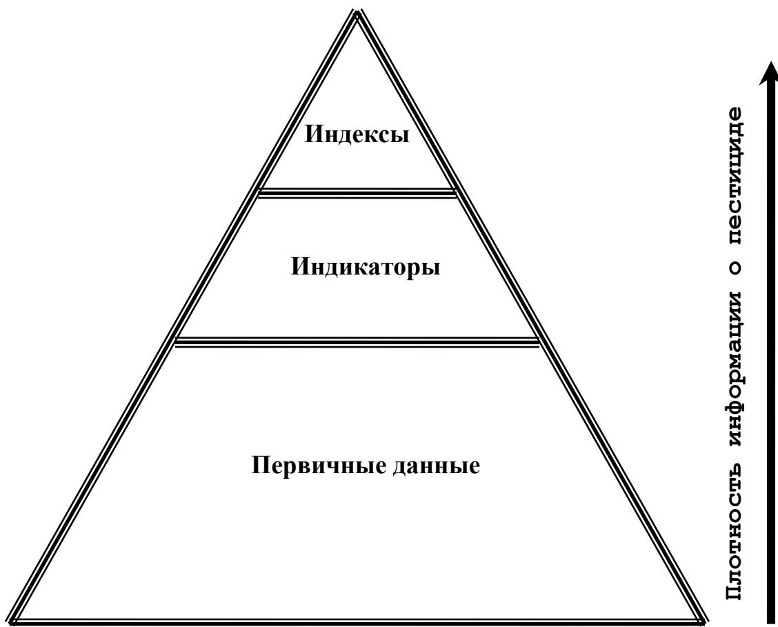
Рис. 1. Структура информации о пестициде